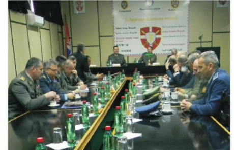
У ОВОМ ДЕЛУ СРБИЈЕ ВЕЛИКИ БРОЈ УСТАНОВА ОД ЗНАЧАЈА ЗА ОДБРАНУ : полазници високих студија у Нишу

деће структуре у министарствима Владе Републике Србије, али и за друге органе и службе у земљи, као и за саму Војску Србије-објашњава Бошњак. Ми се кроз теоријску наставу, различите радне задатке које добијамо и практичну наставу, кроз посете органима и институцијама, као и међународним организацијама, упознајемо са савременим принципима и поступцима у функционисању система одбране и безбедности. Упознајемо се и са регионалним и